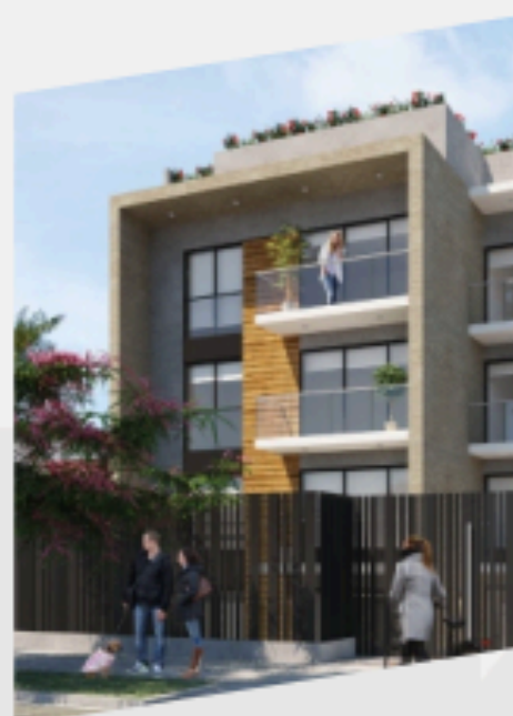
CALLE 26 SAN ISIDRO ENTREGA INMEDIATA