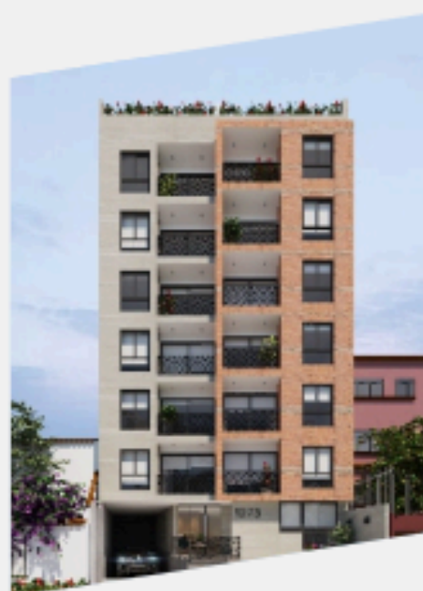
HERNÁNDEZ 1273 PUEBLO LIBRE PRE -VENTA