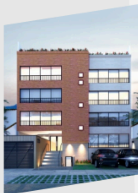
TOSCANINI 129 SAN BORJA EN CONSTRUCCIÓN