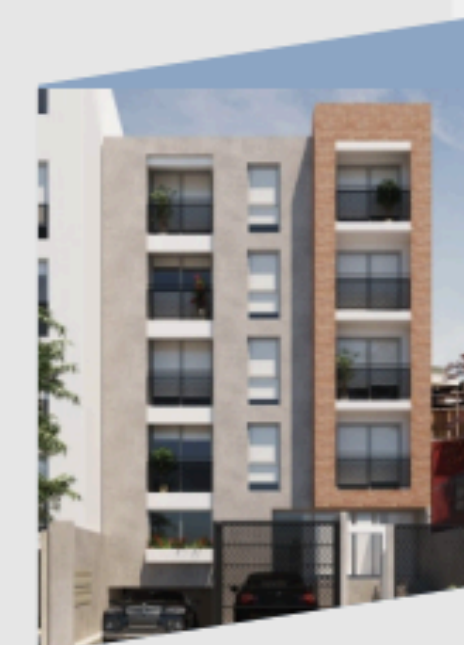
SAN MARTÍN 284 MAGDALENA ENTREGA INMEDIATA