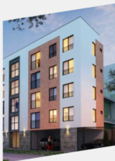
PRADO 1324 MAGDALENA EN CONSTRUCCIÓN