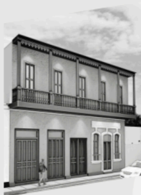
LOS POETAS BARRANCO PRE-VENTA